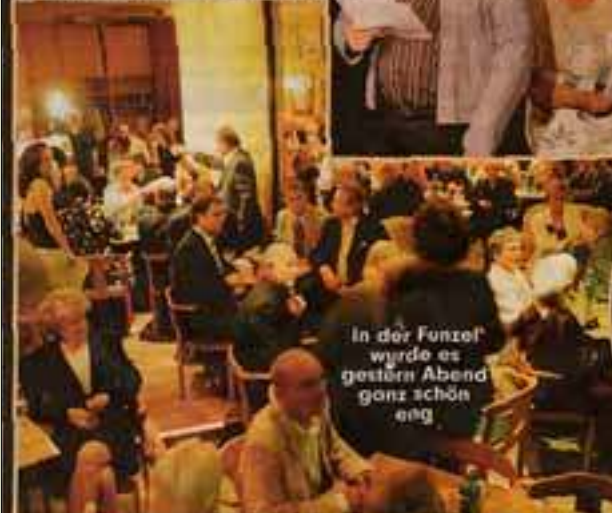
In der Funzel wurde es gestern Abend ganz schön eng