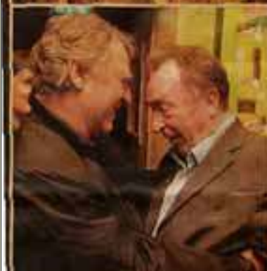
◀ Körperkontrolle, Herr Kollege SOKO-Kommissar Andreas Schmidt-Schaller untersucht Sodann